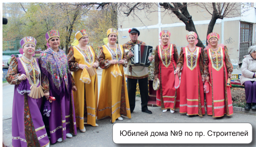
Юбилей дома №9 по пр. Строителей