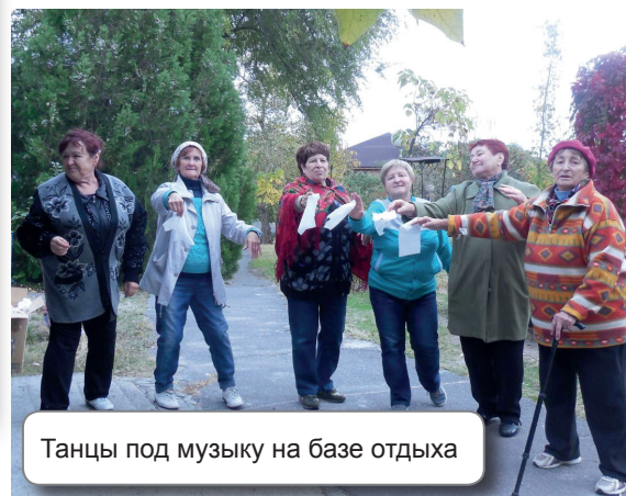
Танцы под музыку на базе отдыха