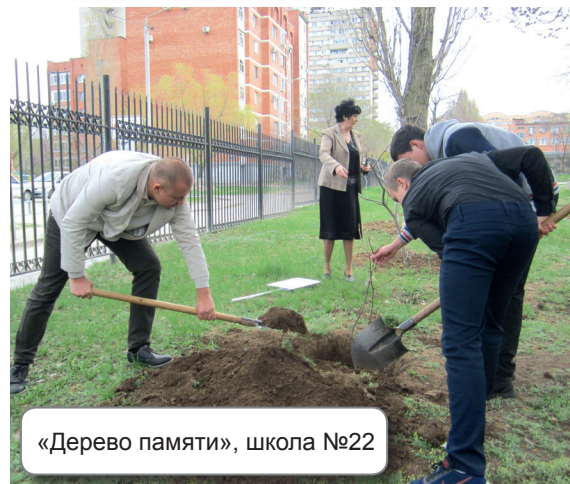
«Дерево памяти», школа №22