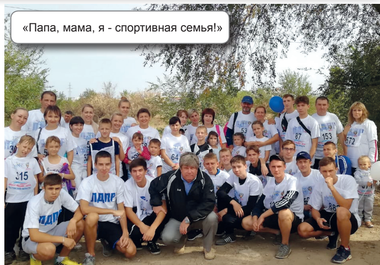
«Папа, мама, я - спортивная семья!»