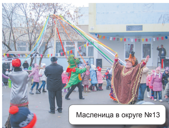
Масленица в округе №13