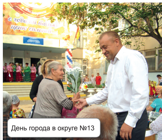
День города в округе №13