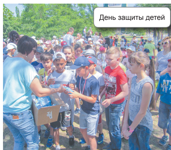
День защиты детей