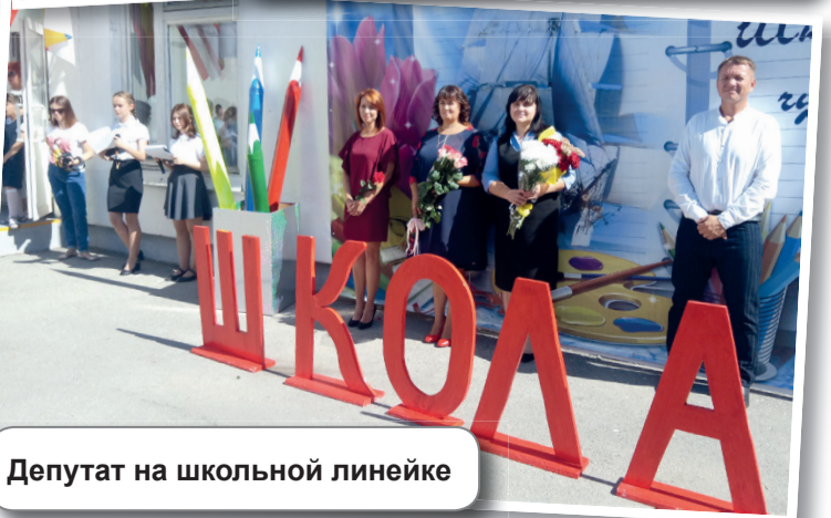
Депутат на школьной линейке