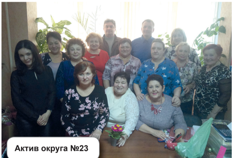
Актив округа №23