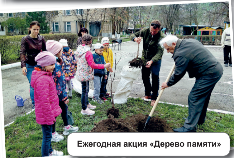
Ежегодная акция «Дерево памяти»